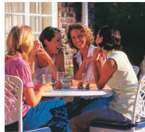
Zeit für das was zählt