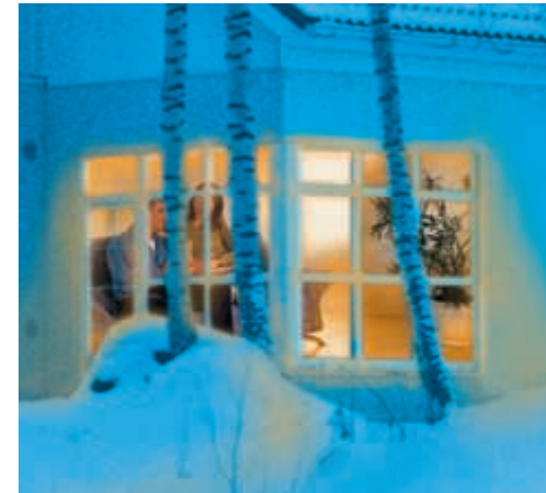
Angenehm wohlig leben